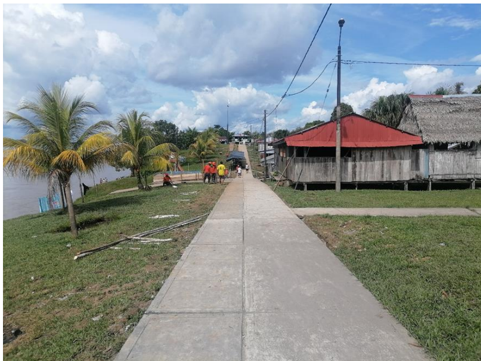
FIGURA N°02: INFRAESTRUCTURAS DE SERVICIO (VEREDAS PEATONALES, ALUMBRADO PÚBLICO) Y VIVIENDAS QUE PUDIERAN SER AFECTADOS POR LA EROSION DE LOS TALUDES.