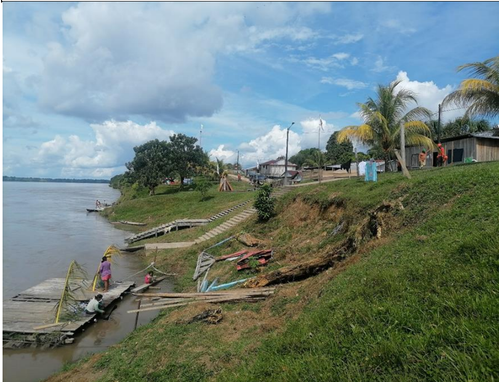
FIGURA N°01: TALUD DEL RÍO NAPO ADYACENTE A LA COMUNIDAD NATIVA NEGRO URCO, SE ENCUENTRA AFECTADO POR LA ACCIÓN EROSIVA DE LAS AGUAS EN ÉPOCA DE CRECIENTE.