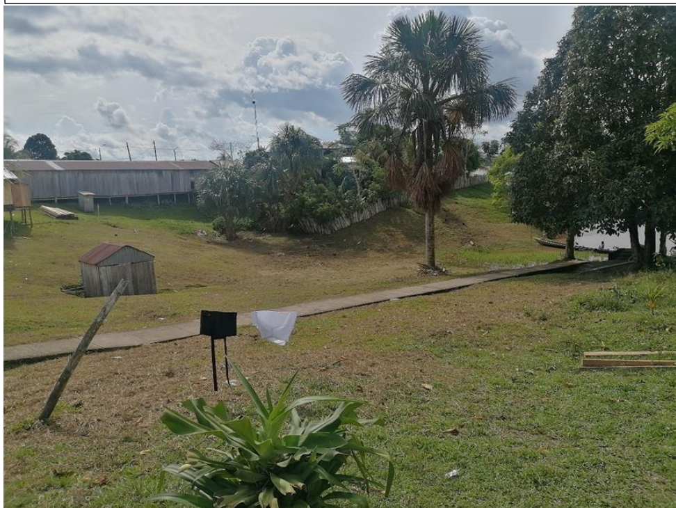
FIGURA N°03: PARTE BAJA DE LA COMUNIDAD NATIVA NEGRO URCO, SE ENCUENTRA VULNERABLE A INUNDACIÓN DEL DEL RÍO NAPO.